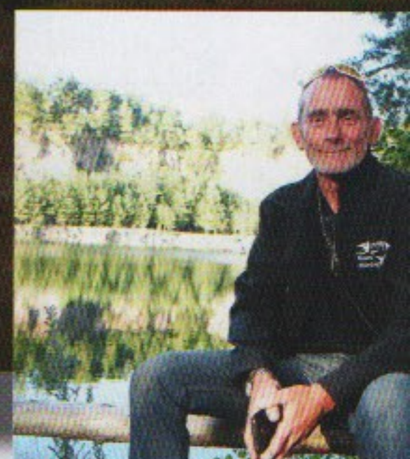
Bruno - Esox Diving

TEXTE : Marc Langleur