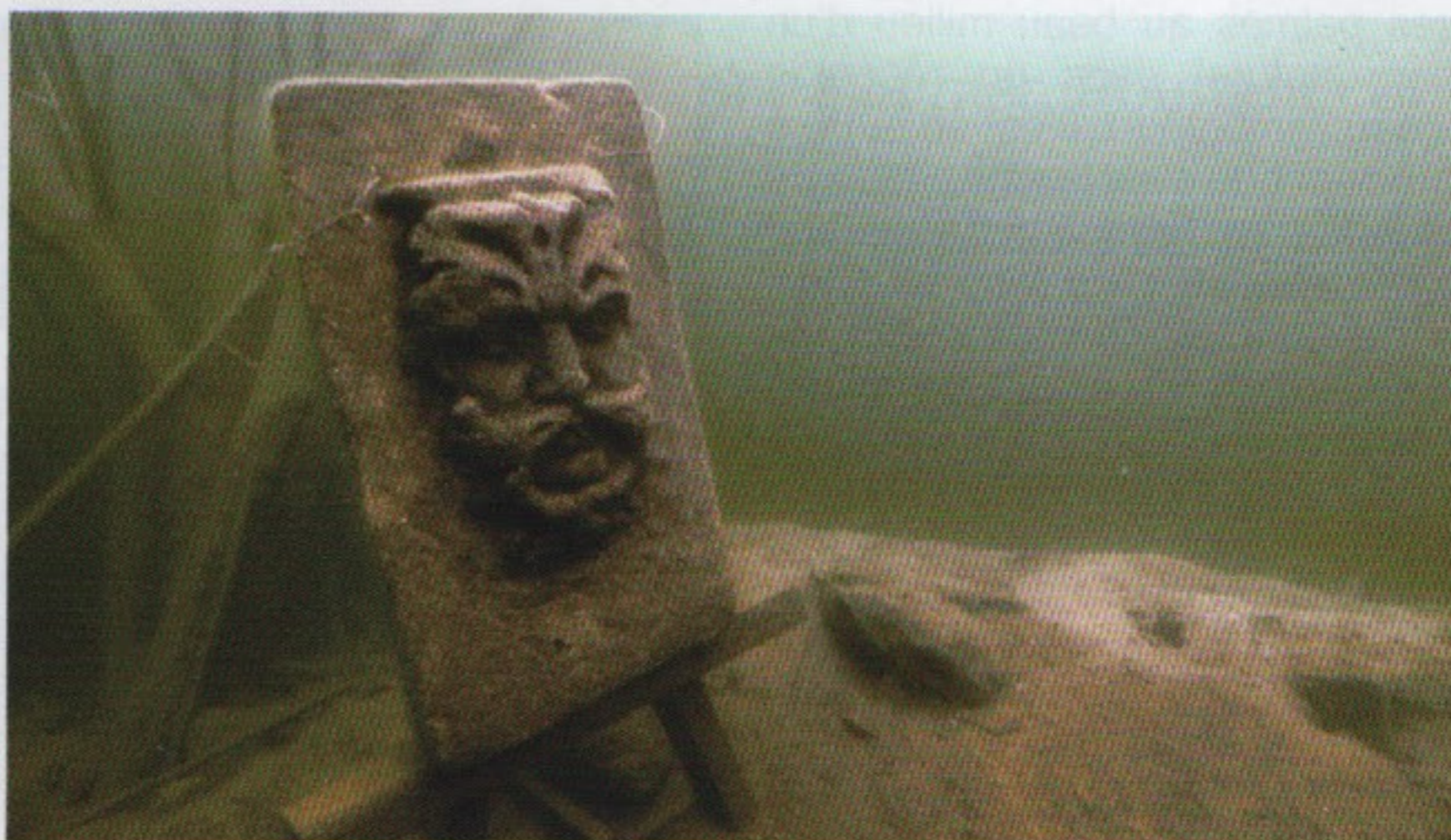
Aménagements insolites sous les eaux de la carrière

Il est enfin à noter qu'Esox Diving est une structure commerciale agréée FFESSM, centre SDI/TDI Training Facility 5*, ainsi que My HSDC (Hippo Sub Dive Center 5* réseau Submatix) et partenaire du Groupe Poly Dive.