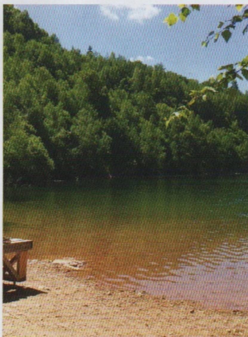
Un lieu paradisiaque où rigueur et sécurité font loi

Il insiste sur le décor de la région, l'eau douce de qualité, chausser ses palmes au beau milieu d'un parc naturel dans un réservoir d'eau alimentaire. Il est en outre à préciser que c'est le seul centre de plongée en France qui regroupe ces différentes conditions. C'est également à l'occasion de sa première plongée qu'il se trouva nez à nez avec un brochet (nom latin : Esox Lucius) d'un mètre et qu'il eut l'idée d'en faire dessiner la forme pour le logo de sa société, ce qui renforce d'autant plus son point de vue de la plongée en carrière, qui permet de s'affranchir de contraintes liées à la mer (marées, courant, conditions météorologiques, chaîne des secours...).