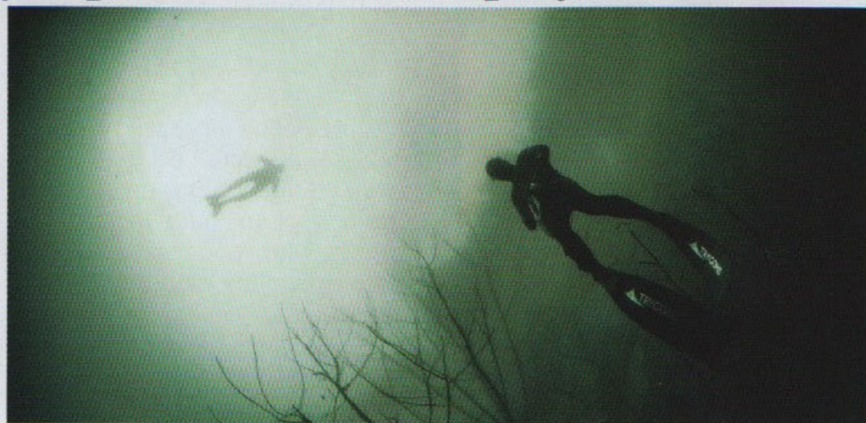
Une ambiance très particulière dans les profondeurs de la Roche-en-Brenil

Le départ plage en pente douce, pour une meilleure sécurité, permet la mise à l'eau. Une plateforme a été aménagée pour les sauts droits et les bascules arrière, de quoi égayer les palmes des plongeurs débutants et confirmés. Différents marquages balisés par des bouées ont été aménagés pour les départs d'exploration ou les plongées techniques, ainsi que pour les exercices de 20 à 55 m. Une plateforme spécifique est réservée à la pratique de l'apnée puisque la carrière permet l'entraînement et le passage des différents examens fédéraux. Le plongeur est donc libre de choisir sa zone d'évolution et en quelques coups de palmes peut accéder aux espaces profonds.